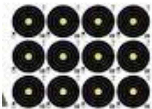
Sasaran 20 cm Jarak 5-20 m*