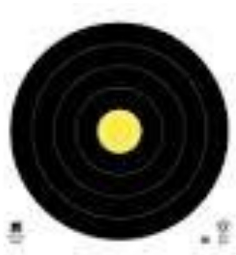
Sasaran 80 cm Jarak 20-60 m*