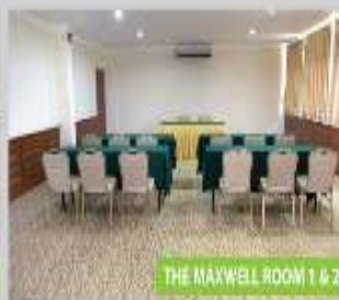
THE MAXWELL ROOM 1 & 2